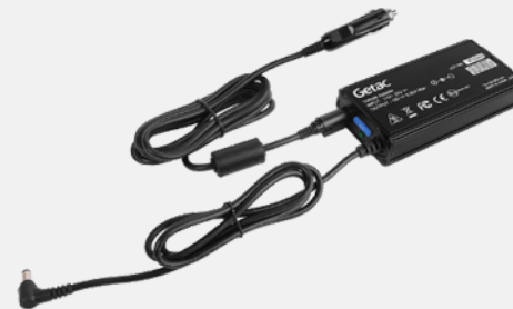
Versión para toma del encendedor