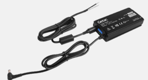
Versión con cable pelado