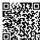
S410 3D demo